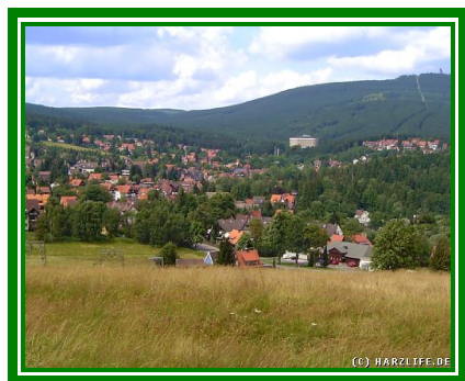
Udsigt over Braunlage

4 Dages busrejse til Braunlage midt i det idylliske bjerglandskab "Harzen" i perioden 7-10. oktober 2011 med 3 overnatninger på det hyggelige Hotel Achtermann i dobbeltværelser med 1/2-pension, rejseleder, udflugter til Goslar og Wernigerode samt besøg i et spændende minemuseum og rejsegarantifond. På hotellet er der elevator, keglebane, krostue og restaurant