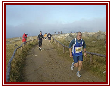
Det går op og ned