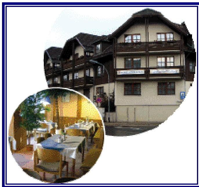
Hotel Achtermann, Braunlage

Der er dejligt i Harzen såvel sommer som vinter. Et behageligt klima, skønne små byer fyldt med bindingsværkshuse, interessante gamle kirker og klostre. Dertil oplever vi charmerende, afvekslende landskaber omgivet af bjerge. Derfor har Harzen gennem mange år tiltrukket mange danske turister.