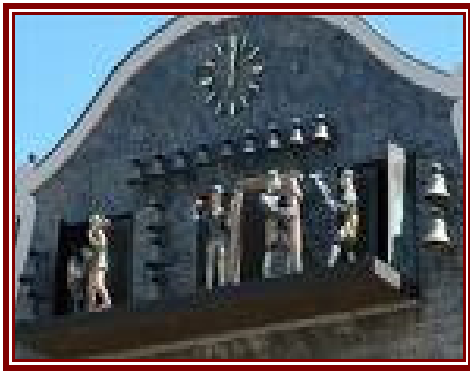
Klokkespillet i Goslar