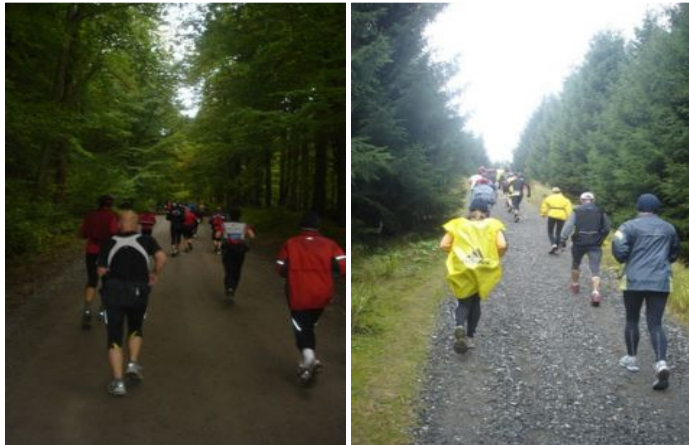
Op igennem skoven - her efter ca. 12km