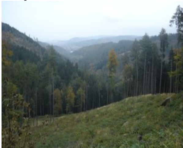
Udsigt på vejen ned