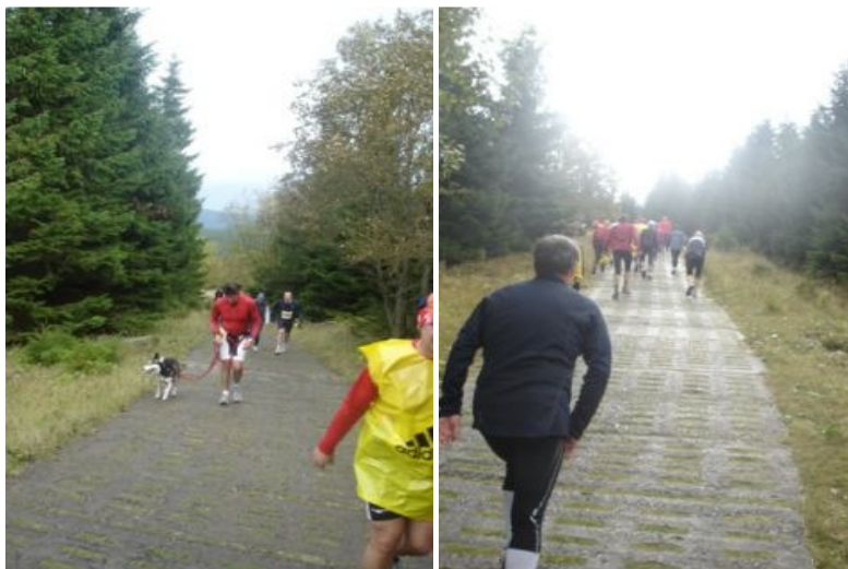
Garmin 301 fortalte mig, at stigningsprocenten her lå på ca. 22% Læg i øvrigt Et af de steder, hvor det går meget stejlt opad. Der var ingen der løb, og jeg selv gik med en puls på over 180bpm. Mit mærke til betonelementerne, der indikerer at vi er ved at nærme os toppen.