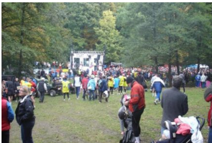
Start- og målområdet