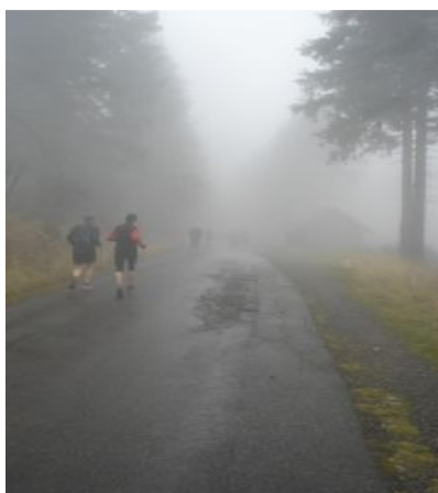
Her har vi næsten lige rundet toppen, og det går nedad igen. De første km efter toppen, er på asfalt - resten er grusveje.